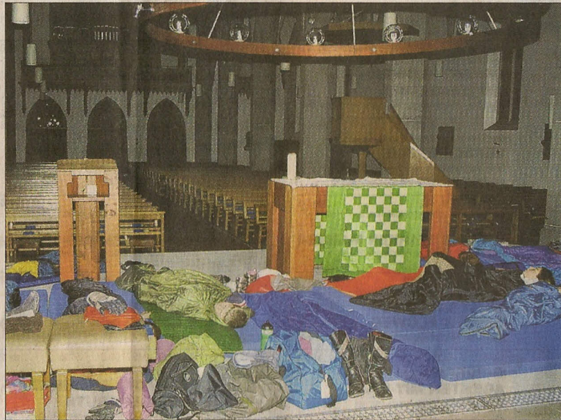
Sie halten Wache für eine Nacht: Mitglieder der Frauengemeinschaft Unterägeri mit ihren Kindern.

Und wenn es hell wird, wird die Aufregung und der kindliche Übermut Erinnerung sein. Jetzt aber züngeln die Flammen in der Feuerschale vor der Kirche. Gegen 20 kleine und grosse